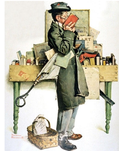
Norman-Rockwell, I Reading a Book